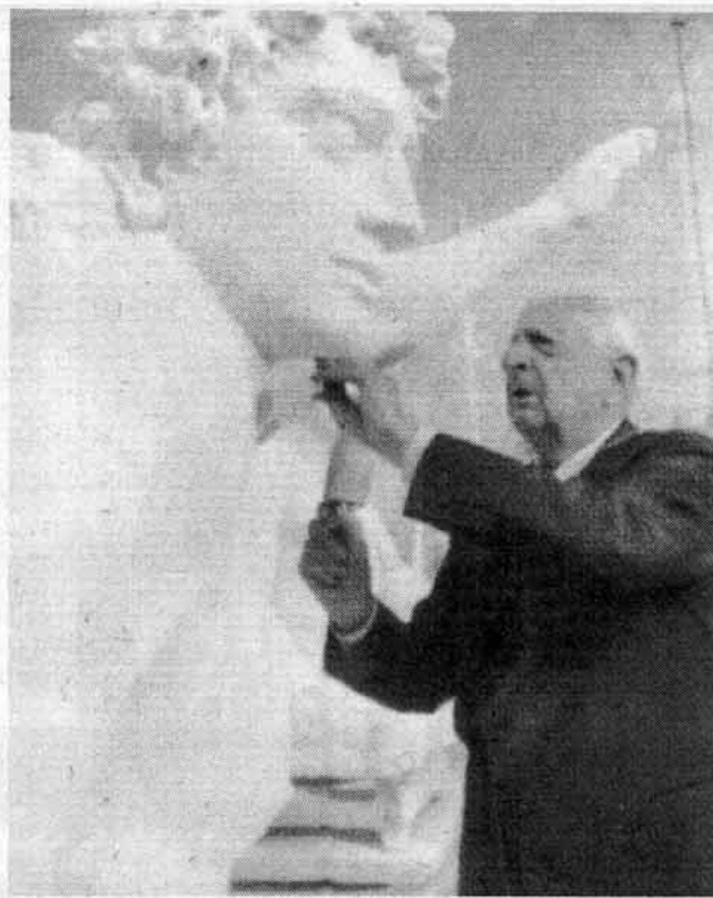
Immagine storica: Giorgio De Chirico scolpisce un blocco della Margraf. È la Triennale di Milano 1973

Quando il campo di applicazione si estende fino a coinvolgere la costruzione e le tecniche edili, allora è più che evidente che si va a ra-